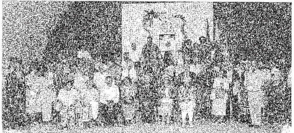
Tous réunis au Club de l'Âge d'or de La Pocatière, autour du gâteau du premier anniversaire.

Cette reconnaissance des lieux s'est faite avec bonne humeur dans un autocar et quelques voitures qui ont sillonné les routes où ont vécu les ancêtres, s'arrêtant ici et là sur les lieux qu'ils ont occupés. Cette randonnée a suivi l'assemblée générale an-